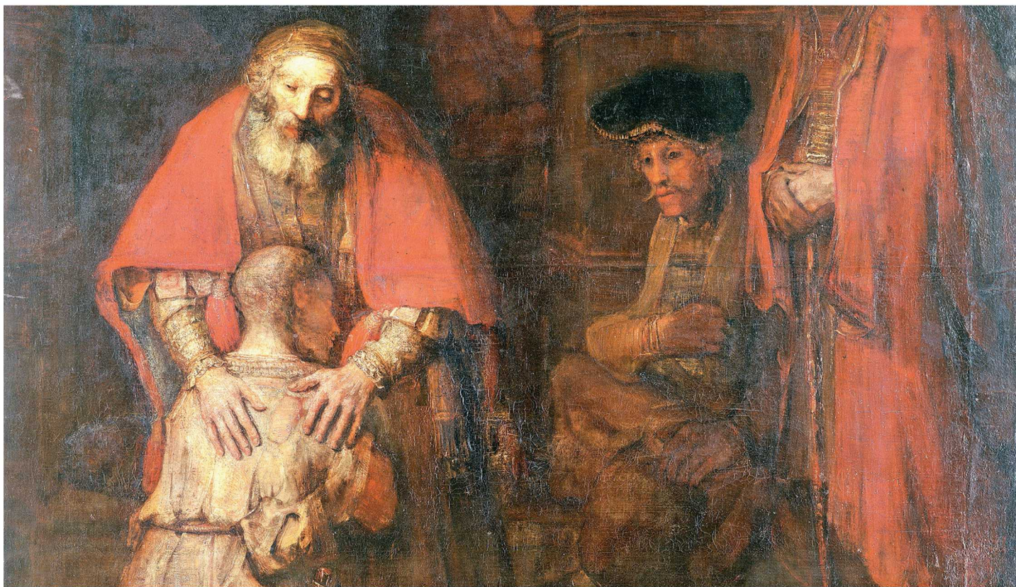
De uitstraling van vaderlijke vergevingsgezindheid en liefdevolle omarming jegens zijn zondige zoon bevrijdde Henri Nouwen van zijn twijfels en onzekerheden.